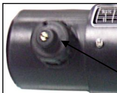
Клапан подачи препарата

Против часовой стрелки, увеличение потока.